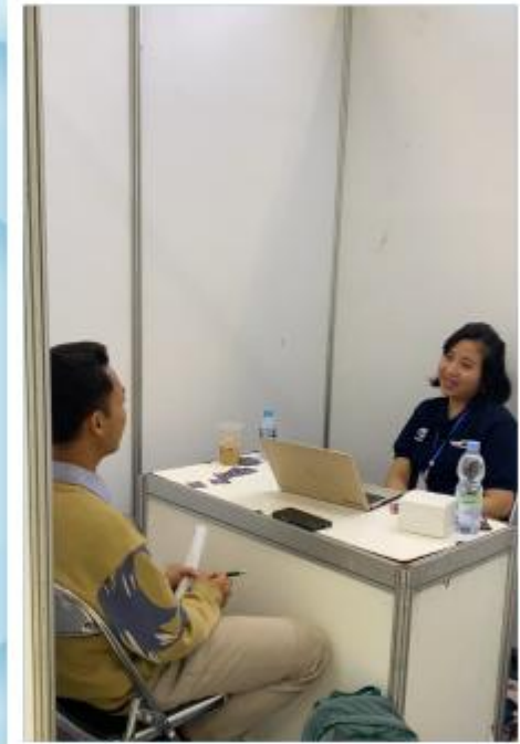
Walk In Interview